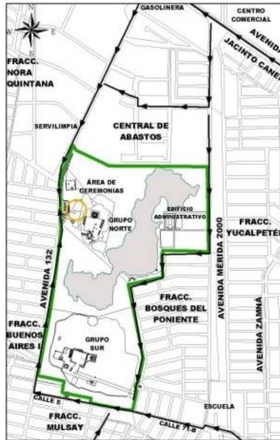
"Parque Arqueo-ecológico Xoclán"